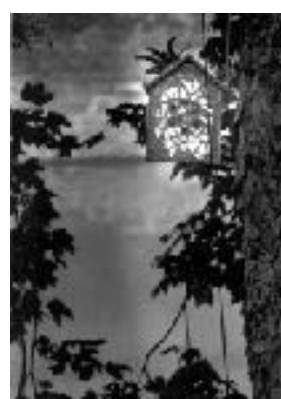
parcours de l'eau