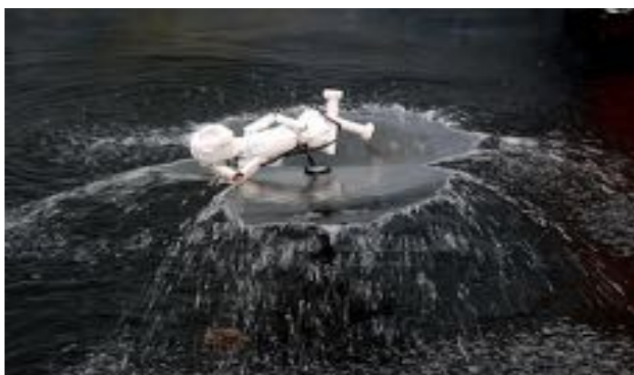
parcours de l'eau

Pour cette même occasion, nous avons adapté le parcours de la terre - initialement créé dans des parcs publics (Rugles) et privé (Château du Taillis, Duclair) - dans 3 yourtes sur les quais en bord de Seine, afin de recréer un parcours en jardins intérieurs